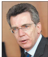
Thomas de Maizière kritisiert Wissensdefizite über DDR bei Jugendlichen.

Seite 4: Leitartikel und Hintergrundberichte