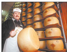
Oft kopiert und oft gestohlen: Italiens Käsespezialität Parmesan.

ens, sondern auch die am häufigsten gestohlene. Position zeigt belegen Fleisch und Aufschnitt. Abgesehen von Lebensmitteln werden in »Bella Italia« viele Rasierkliegen heimlich mitgenommen: Jede fünfte Packung verschwindet unbezahlt aus den Regalen. Insgesamt wurden in Italien den Angaben zufolge zwischen Juni 2006 und Juni 2007 Güter im Wert von 3,08 Milliarden Euro entwendet, wobei die Täter besonders häufig im Norden des Landes zuschlagen.